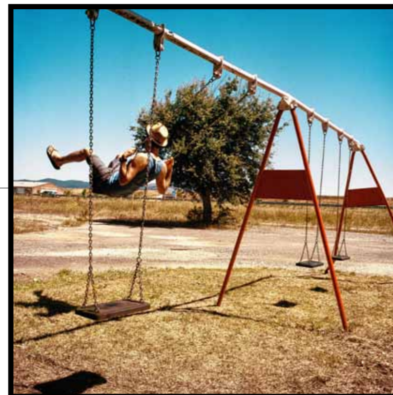
Recreatiezone bij een tankstation in Zuid-Spanje.