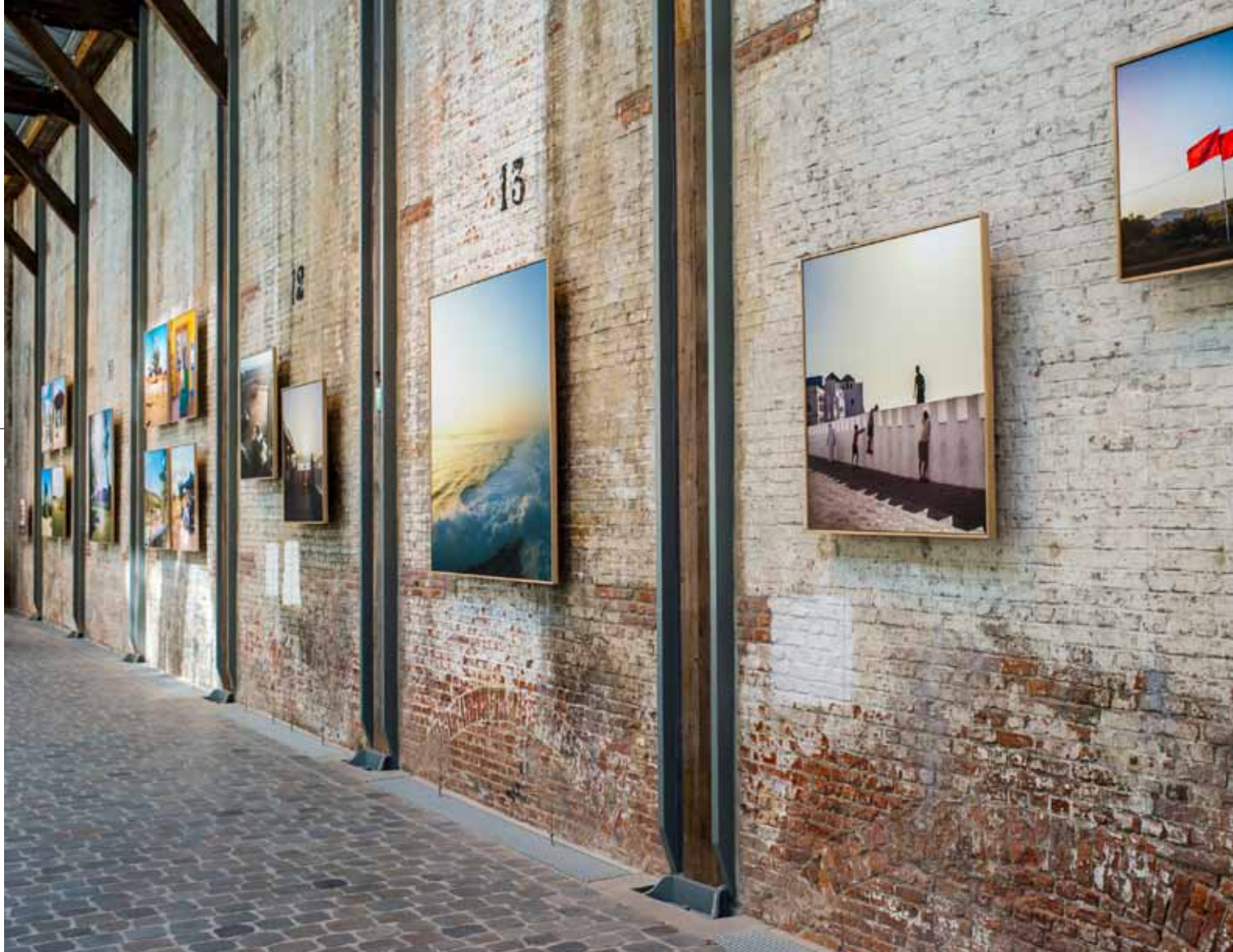
De foto's van de reis zijn sober ingelijst, en hangen aan de ruwe muur van De Loods.