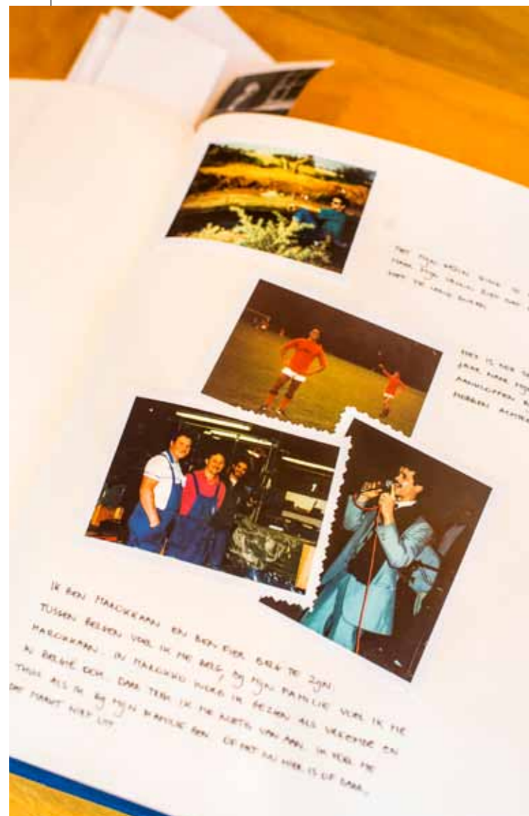
In fotoalbums vertellen Antwerpenaars met allochtone roots over de reizen naar hun moederland.

Tussendoor stortte ze zich op eigen projecten en fotografeerde ze in opdracht van The New York Times , Newsweek en een paar grote Franse kranten. Een behoorlijk indrukwekkend parcours, zeker toen ze in 2009 ook nog eens de World Press Photo kreeg voor een foto uit de reeks bootvluchtelingen die ze fotografeerde.