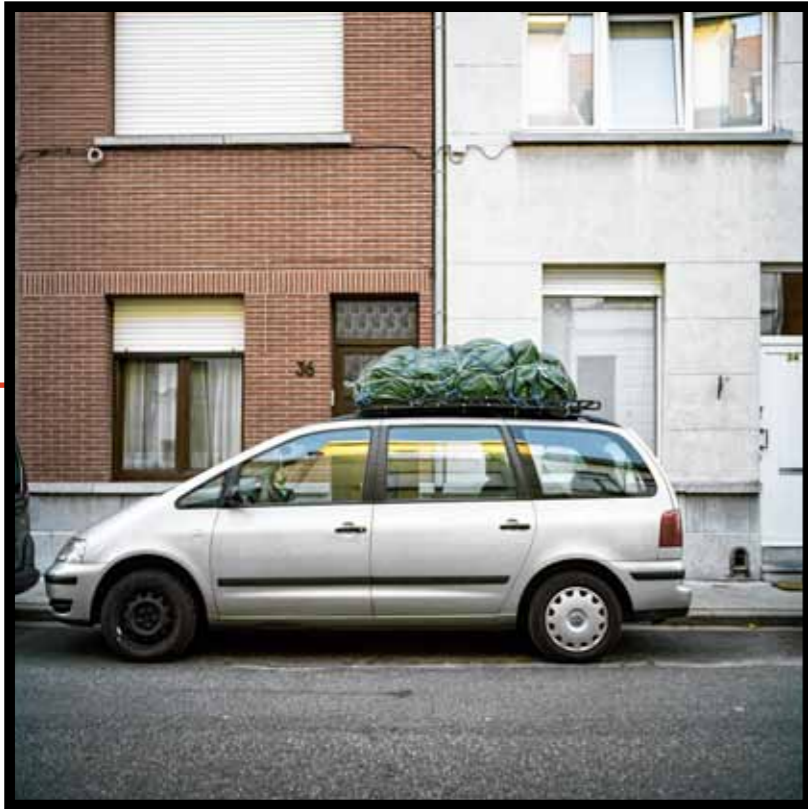
Vertrek in Antwerpen.