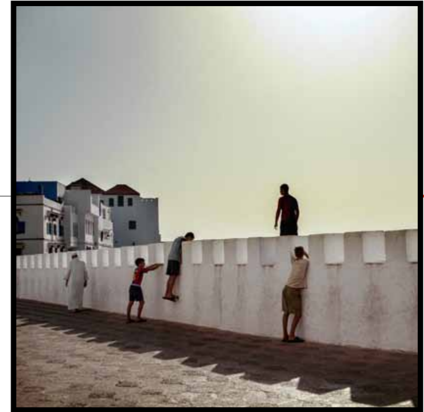
Jongeren in Tangerang.