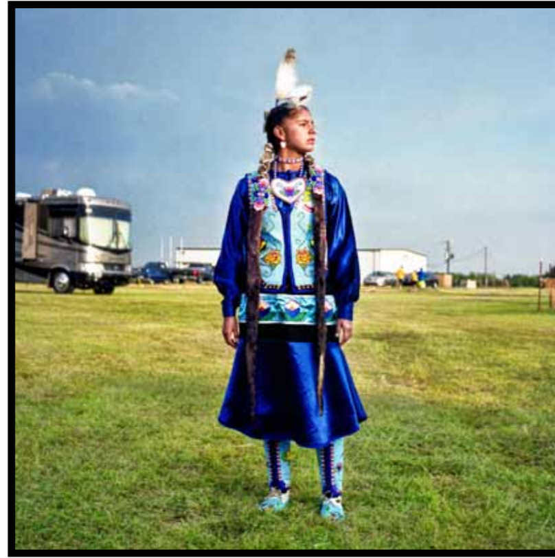
En in haar weekendoutfit.