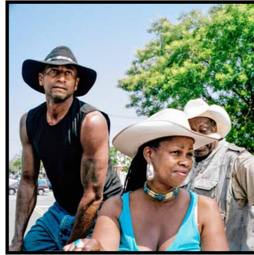
Leden van de Black Cowboy Federation in Brooklyn, New York.