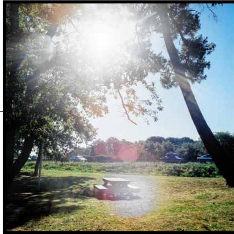
Verlaten picknickbank met vakantiegangers op de achtergrond.